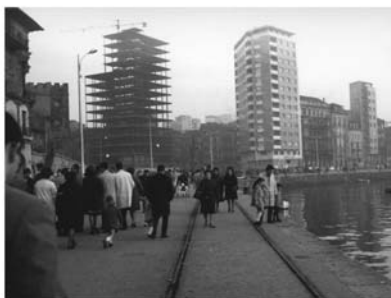
Negativo de 35 mm 1967. Gonzalo del Campo y del Castillo Paseo del Muelle (Gijón)